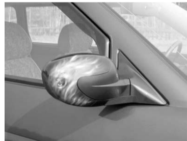
Стильный дизайн «Волны» придает отечественному автомобилю солидный внешний вид

Вот такая история. Самое главное, что она многому учит. Вроде бы зеркало – такая мелочь, а как ощутимо влияет на уверенность и безопасность за рулём!