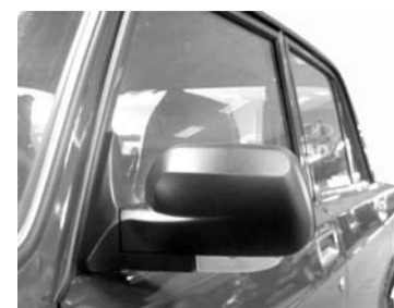
Зеркала «Т-7» существенно повышают ранг вазовской «классики» в глазах автолюбителей: солидный внешний вид

шой разлуки со своей «ласточкой», я по привычке запасся терпением и свылся с мыслью, что придется потратить несколько минут на регулировку зеркал «под себя». Ведь сами знаете, процесс этот довольно трудоёмкий, особенно регулировка правого зеркала... Каково же было моё удивление, когда меньше чем за минуту зеркала приняли привычную для меня настройку! Что характерно, их регулировка происходит плавно, без заеданий и рывков.